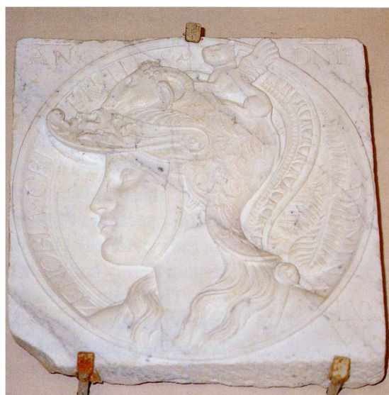
Fig. 9: Bassorilievo con iscrizione menzionante Zenobia ( CIL X, 1092* )