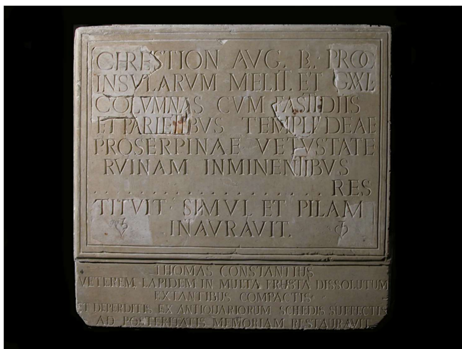
Fig. 5: Dedicata a Chre[stion], procurator di Melita e Gaulos con menzione del tempio di Proserpina (CIL X, 7494)