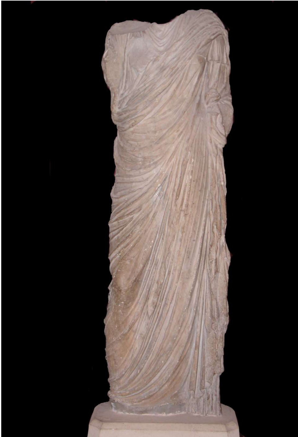
Fig. 3: Statua acefala di Ceres Iulia Augusta