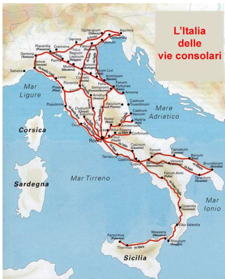
Fig. 6: Le strade consolari romane tra cui la via Appia e la via Popilia .