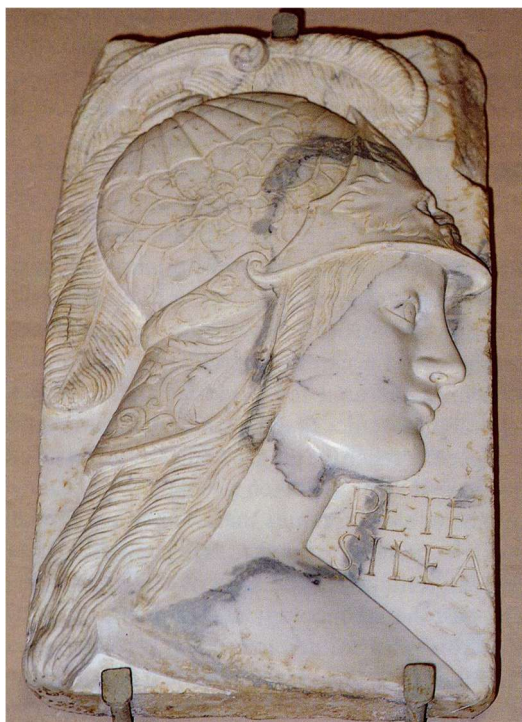
Fig. 8: Bassorilievo con iscrizione menzionante Pentesilea ( CIL X, 1090* ) – (foto S. Ganga)