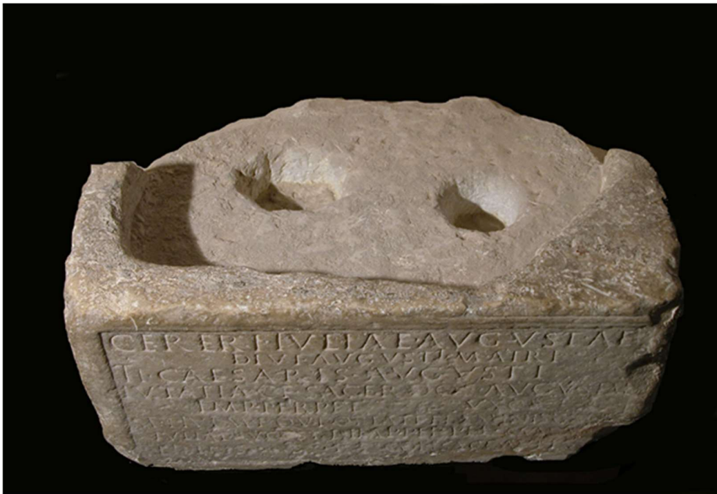
Fig. 2: Iscrizione con dedica a Ceres Iulia Augusta (particolare del supporto)