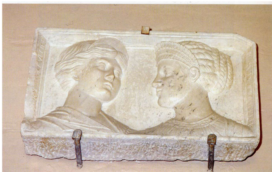
Fig. 7: Bassorilievo con iscrizione menzionante Tulliola , figlia di Cicerone ( CIL , X 1091*)