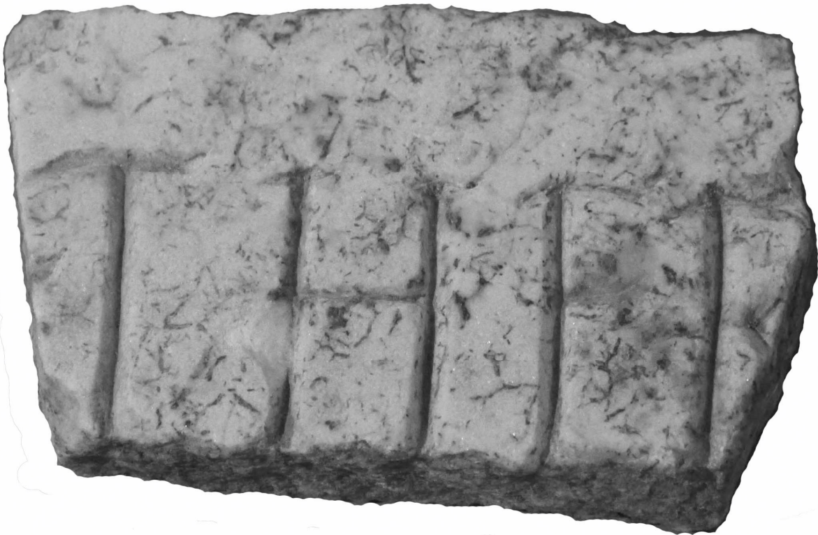
Texte 4 : Panneau d'indication des thermes.