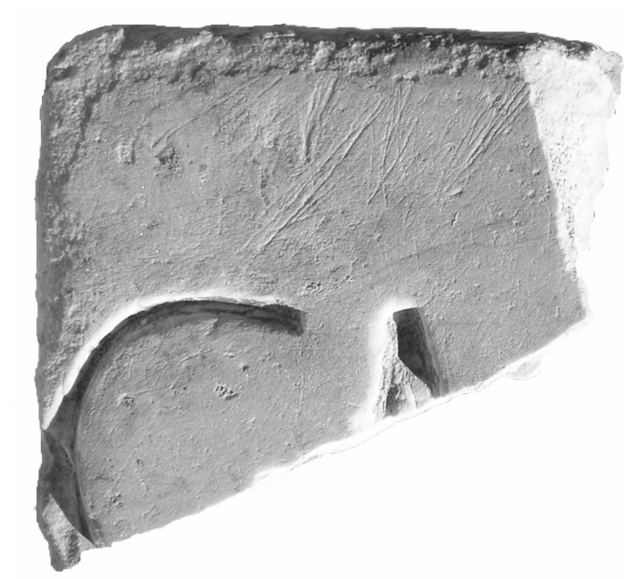
Texte 1 : Fragment d'inscription provenant du pavage du forum.