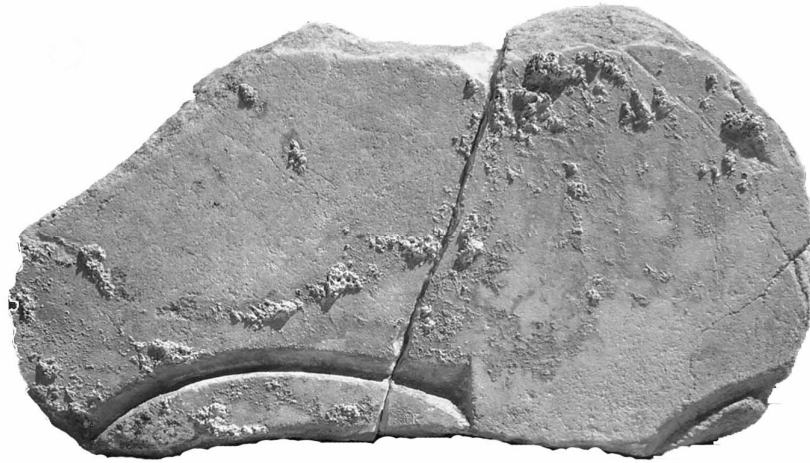
Texte 3 : Fragment d'inscription provenant du portique du forum.