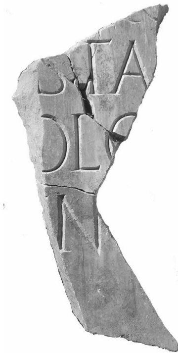
Texte 8 : Dédicace à la déesse Rome Auguste de la part des colons d'Aleria.