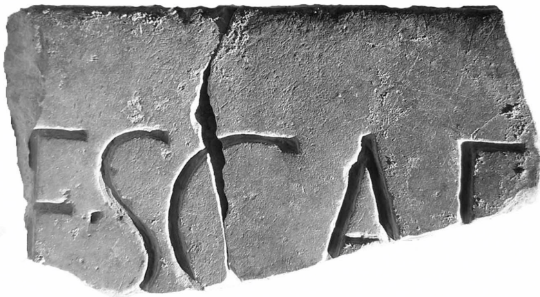
Texte 2 : Fragment d'inscription monumentale portant mention du gouverneur C. Mucius Scaevola.