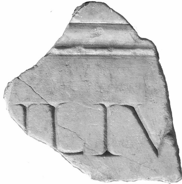
Texte 10 : Fragment de filiation impériale.