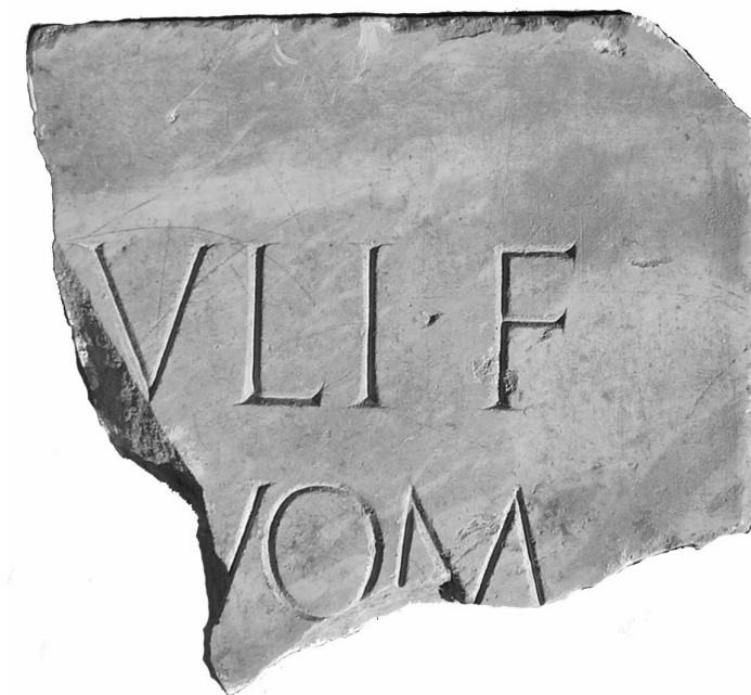
Texte 9 : Mention fragmentaire de l'empereur Auguste.