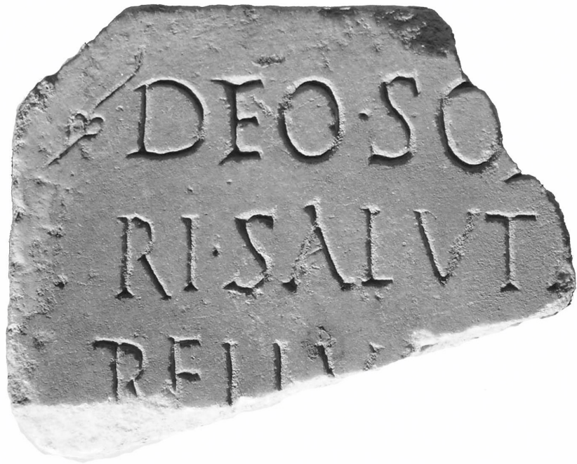
Texte 5 : Dédicace au dieu Soleil Vainqueur et Salutaire.