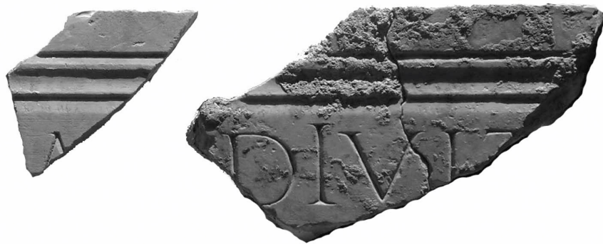
Texte 6 : Mention fragmentaire de l'empereur Hadrien.